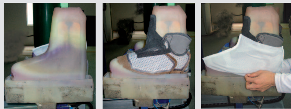
A sinistra: sagoma in gomma silconica. Al centro: la tomaia è rivoltata e posizionata sulla sagoma. A destra: il set di membrana è posizionato sopra alla tomaia con il mesh di collante rivolto verso la tomaia. L'insieme è pronto per essere inserito nella camera di pressatura.

Nel caso della calzatura, il processo di laminazione viene realizzato in un unico passaggio dalla pressa OutDry 3D (vedi immagine sottostante). Questa macchina, brevettata da Nextec in più di 20 paesi del mondo e sviluppata grazie ad una stretta collaborazione con Sagitta Spa - Vigevano (leader nella produzione di macchine per l'industria calzaturiera) è in grado di sviluppare una pressione molto elevata, fino a 10 tonnellate, perfettamente uniforme su una superficie tridimensionale come è appunto quella di una tomaia di calzatura già cucita e completa. A questa pressione viene associato un riscaldamento che serve ad attivare il collante a punti necessario per l'adesione della membrana alla superficie interna della tomaia. La tomaia cucita e già dotata di ganci viene perciò rivoltata e collocata su una apposita