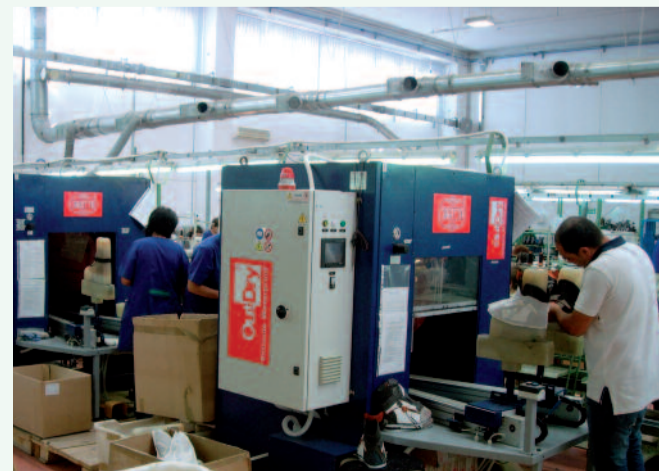
Presse OutDry installate su una linea produttiva.