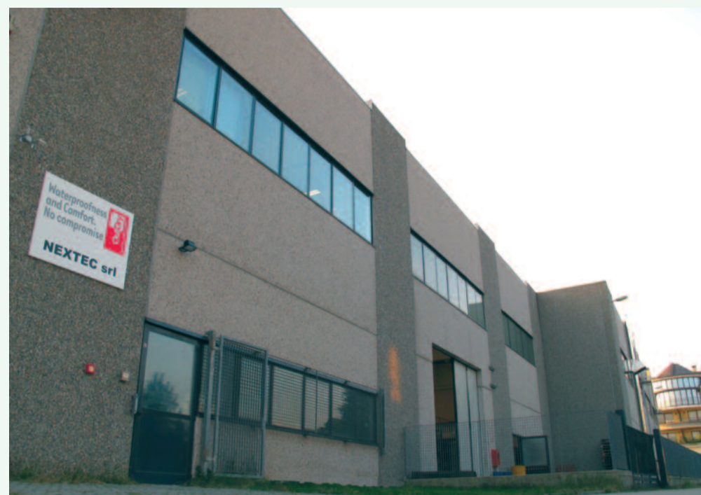
La sede Nextec di Busto Arsizio, in provincia di Varese.

set" disegnati per i modelli dei clienti. Qui sono anche installate alcune macchine OutDry di laminazione per calzature e guanti, che utilizziamo sia per la realizzazione di piccole serie e campioni, sia per testare nuove soluzioni tecniche. Vi è infine un laboratorio che comprende l'area per l'attività di R&D ed i macchinari per i test (flessione in acqua, centrifuga, ecc.) dei prodotti finiti. Al piano superiore vi è un grande open space dove sono collocati gli uffici amministrativi e commerciali e l'area riunioni. L'azienda, oltre al management, impiega 6 dipendenti, di cui due si occupano della contabilità e della logistica, una della segreteria commerciale, mentre tre sono impegnati nelle attività di magazzino e produzione. Oltre alla sede italiana abbiamo anche una struttura di circa 1.800 mq a Guangzhou, in Cina. Di fatto replica il modello organizzativo della casa madre ma, grazie alla importanza dell'area produttiva circostante, è cresciuta in modo più rapido ed impegna oggi complessivamente circa 20 persone. Una parte importante dell'attività di R&D viene svolta in questa struttura, soprattutto quella più applicativa, che comprende la sperimentazione sulle linee di produzione dei clienti di nuove idee e soluzioni tecniche.