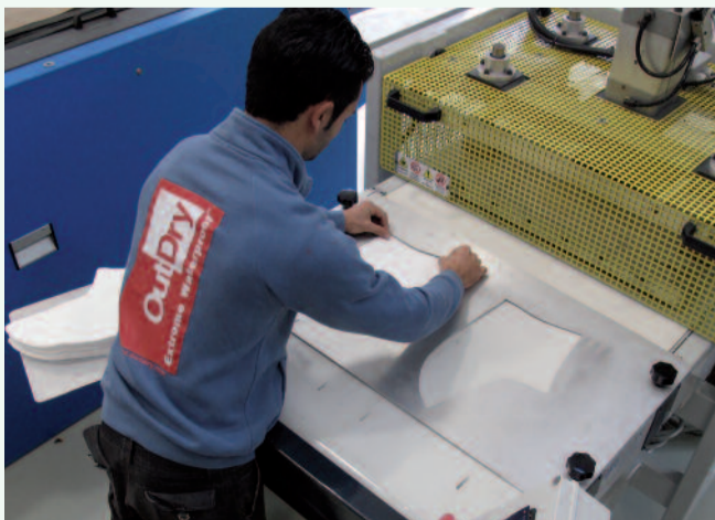
Saldatura HF di set di membrana OutDry.