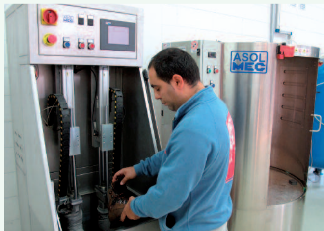
Laboratorio test OutDry.

Il processo OutDry è stato progettato per essere utilizzato sulle linee produttive delle industrie